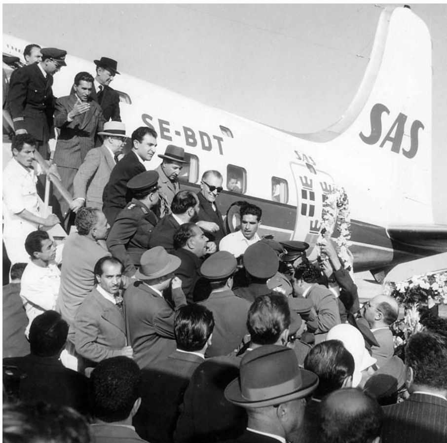
فرودگاه مهرآباد فضل‌الله زاهدی، اردشیر زاهدی - شعبان جعفری [ ۱۲۰-۱۱۴ز ]

□ جالب است که خود شعبان هم در خاطراتش تصریح دارد: «روز ۲۸ مرداد... اصلاً طیب دستش توکار نبود». ۱۰