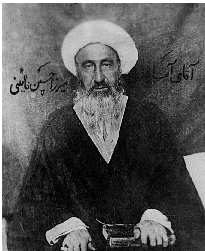
آیت‌الله میرزا حسین نائینی [۸۰۰-۱۳۰۰ع]

هشیاری خود رهبر، عمدتاً بردوش «سیمهای رابطه‌ی خود» منابع اطلاعاتی» می‌کند [می‌باشد] و مهم‌تر از این، به مثابه‌ی اهرمی در جهت رفع مشکلات و مواضع نهضت، و اتخاذ تاکتیکهای لازم سیاسی و تبلیغاتی، از آنها بهره می‌جوید. مجاری ارتباطی و منابع اطلاعاتی، توان اجرای نقشی دوگانه دارند؛ هم می‌توانند اطلاعات درست و به موقعی از واقعیت رویدادها و جریانات پشت پرده را به رهبران برسانند و با تقویت آگاهی آنان موجبات پیروزی نهضت را فراهم آورند؛ و هم می‌توانند در جهت «اغفال» رهبران از مصالح و مشکلات واقعی «نهضت»، و توطئه‌های مودیانه دشمن عمل کنند. از این روی، سلامت و صلابت