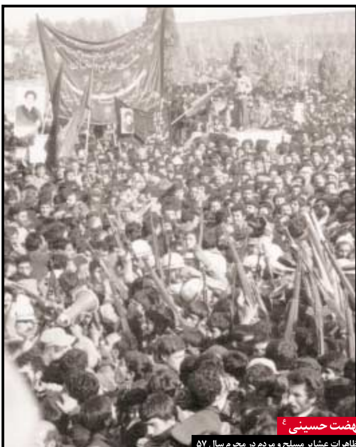
نهضت حسینی ع

تظاهرات عشایر مسلح و مردم در محرم سال ۵۷