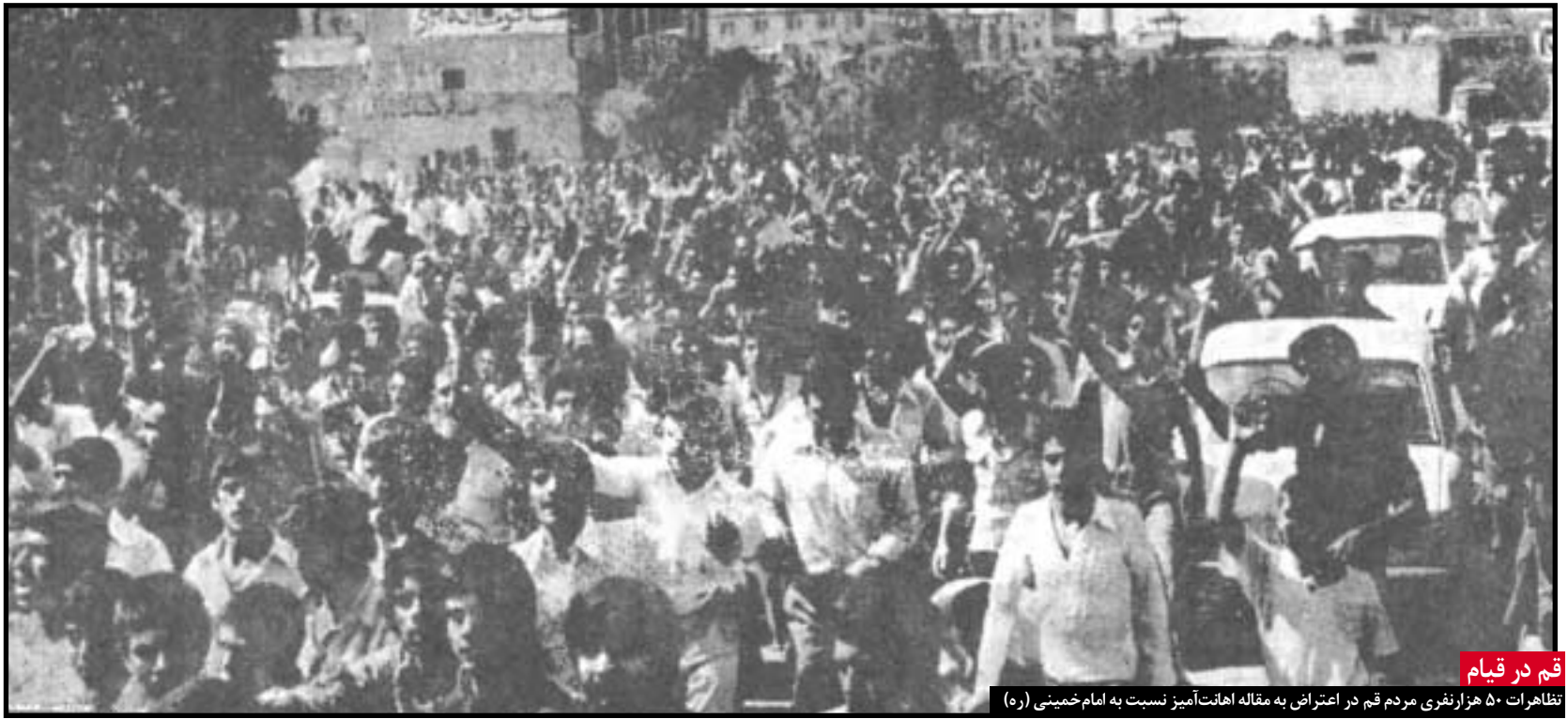
قم در قیام

تظاهرات ۵۰ هزار نفری مردم قم در اعتراض به مقاله اهانت‌آمیز نسبت به امام خمینی (ره)