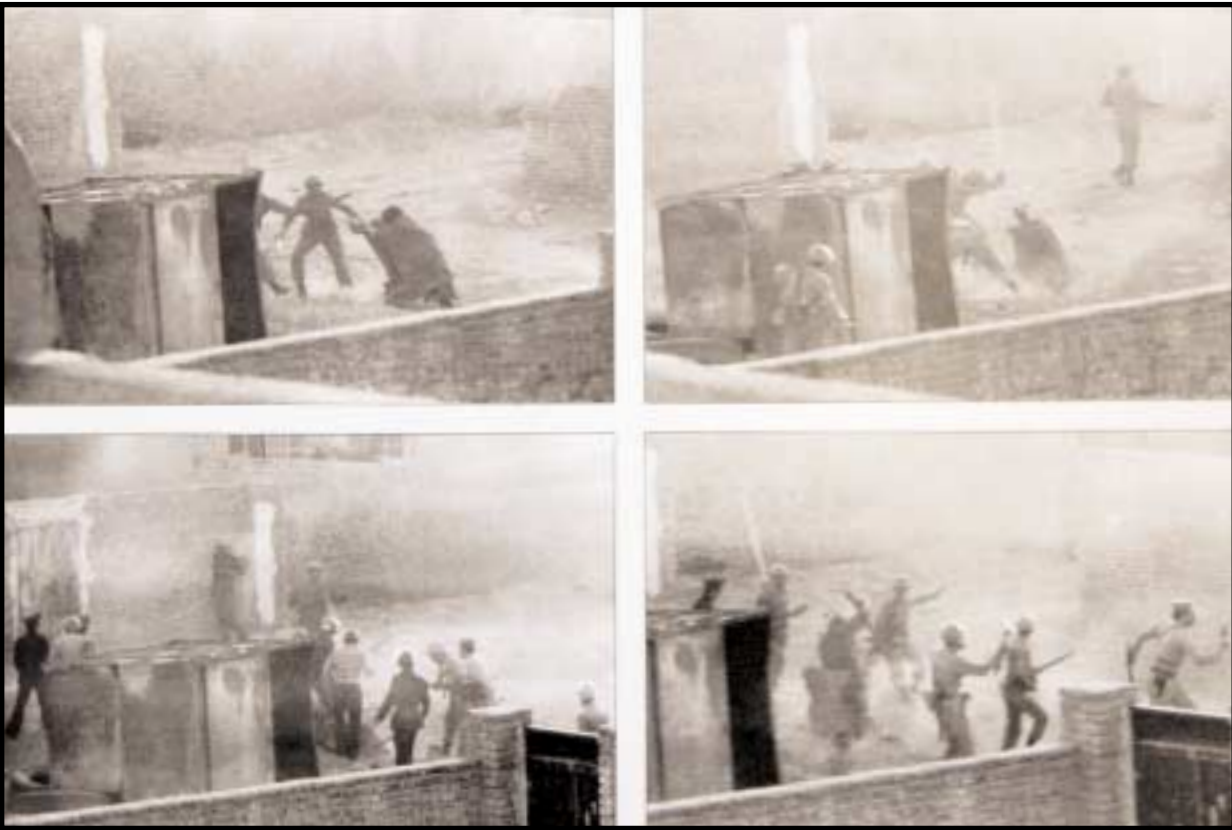
فهرست اطراف مدرسه فیضیه، جلوگیری از پخش اعلامیه‌های امام خمینی (ره) و ضرب و زخم روز حائونان / عیاش ملکی

کشور به مناسبت درگذشت ناگهانی فرزندشان است که چکیده گزاره‌های مهمی از آن بدین قرار است: