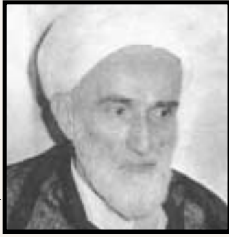
مرحوم شهید الاسلام فلسفی

از ساعت ۱۰/۰۰ روز جاری (۳۶/۱۰/۲۱) [۲۵] جلسه‌ای در منزل فلسفی تشکیل و با اظهار این نکته که به روحانیت توهین شده، به وعاظ شرکت کننده یادآور شده است که باید در این مورد عکس‌العمل نشان دهند.