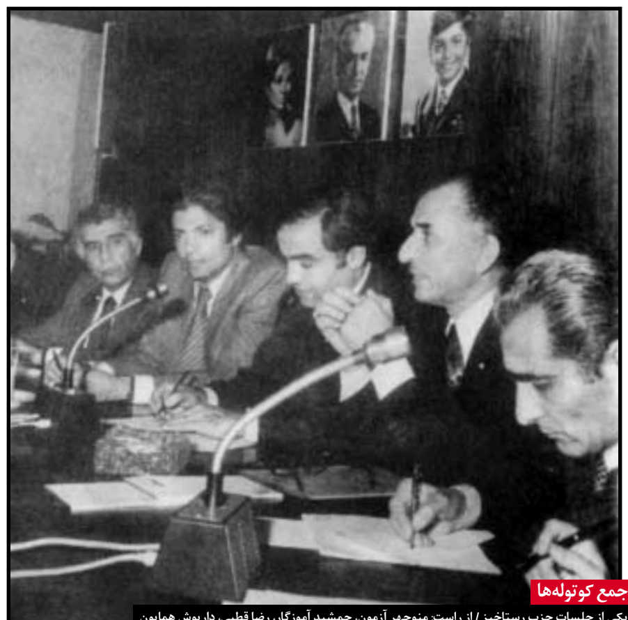
جمع کوتوله ها

تظاهرات عشایر مسلح و مردم در محرم سال ۵۷