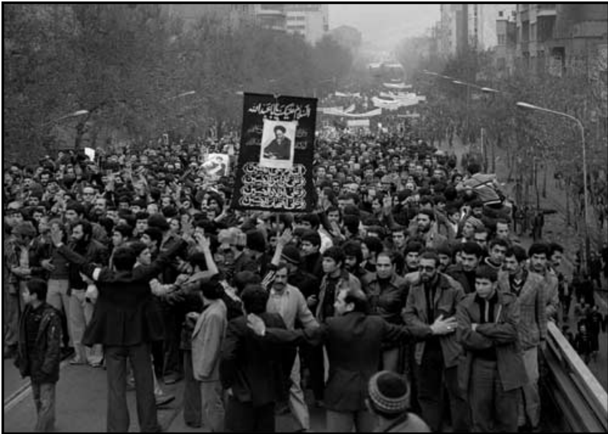
تهران، پل کالج، راهپیمایی عظیم مردمی در ناسرعای حسینی (۱۹ آذر ۱۳۵۷)