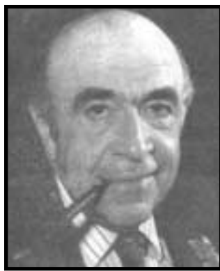
مرحوم شهید امیراباس هویدا

پیرامون عوامل و علل نگارش و چاپ مقاله توهین آمیز روزنامه اطلاعات علیه امام خمینی (در ۱۷ دی ۵۶) نظریات گوناگونی ابراز شده است. یکی از نظریات این است که در جریان جنگ قدرت پنهانی در درون رژیم شاه، هویدا که پس از ۱۳ سال نخست‌وزیری جای خود را به رقیب سیاسی‌اش، جمشید آموزگار داده بود، برای ایجاد چالش فراروی دولت وی و