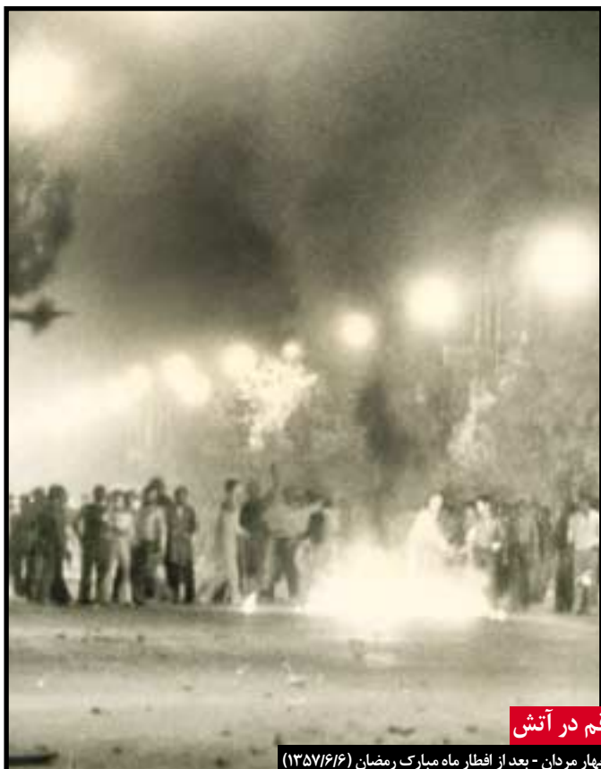
قم در آتش

شاه در سفر به شوروی توانست حمایت کرملین از خود را نیز جلب کند