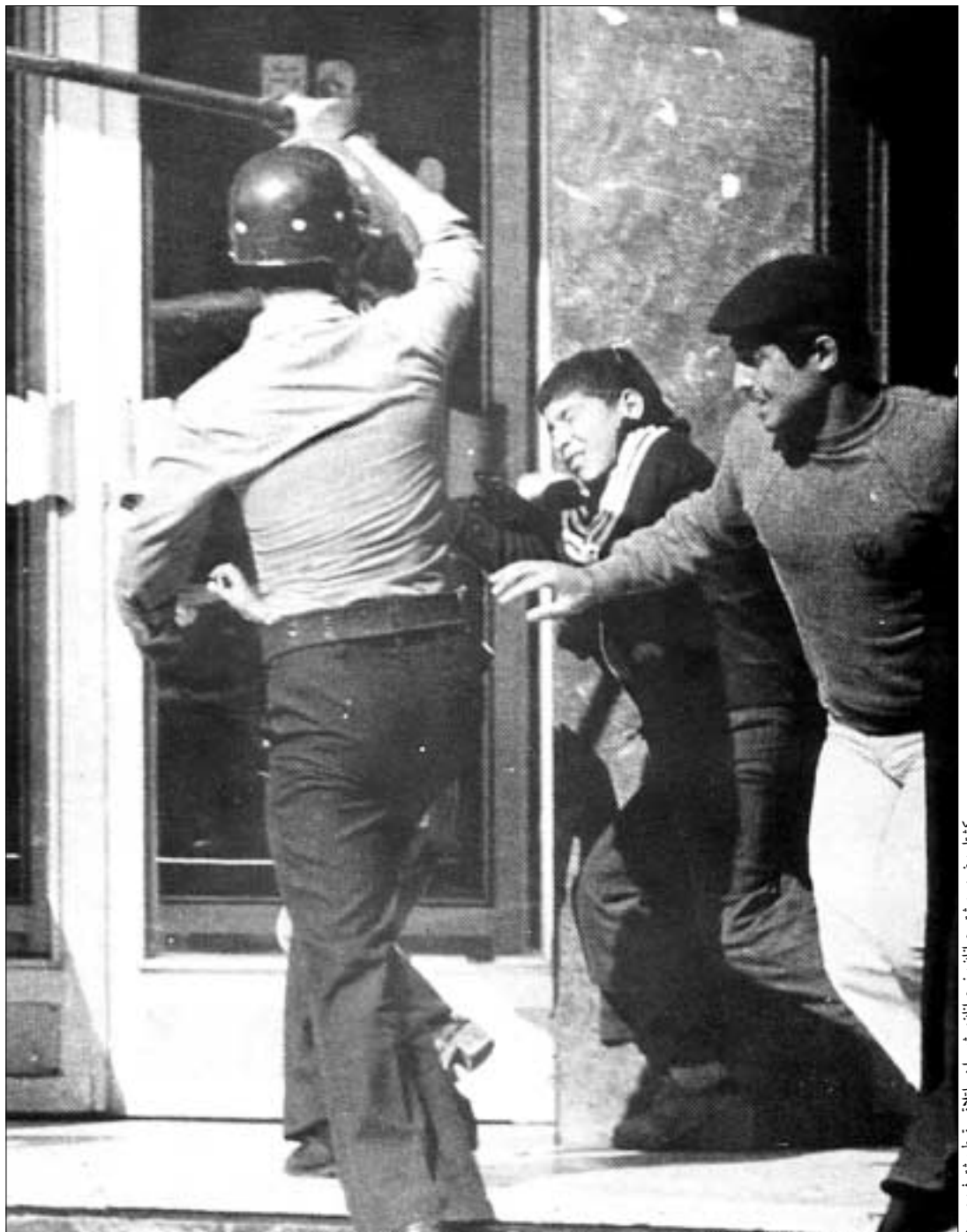
کشتار و ضرب و شتم جوانان و نوجوانان، رژیم را در پایتخت سقوط بیشتر کرد می‌برد.