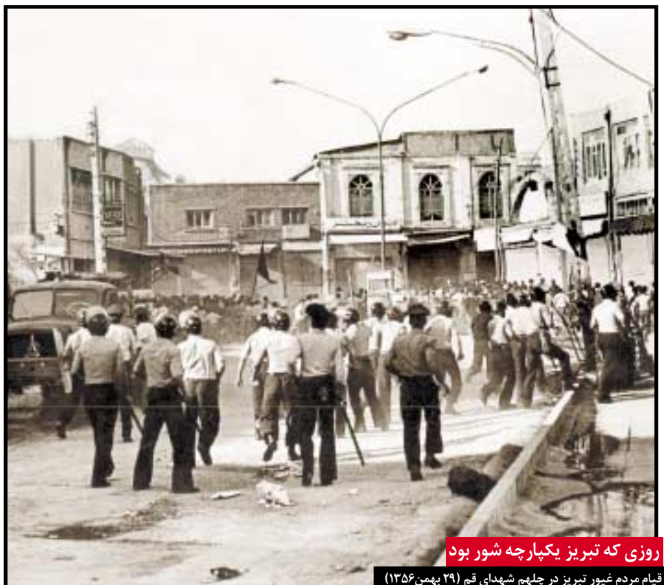
روزی که تبریز یکبارچه شور بود

چهارمردان - بعد از افطار ماه مبارک رمضان (۱۳۵۷/۶/۶)