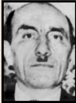
سیدجلال تهرانی، رئیس سستی شورای سلطنت

سال ۱۳۵۷ در دوران انقلاب اسلامی هنگامی که آشکار شد روند تحولات انقلابی کشور به مرحله بازگشت ناپذیری رسیده و امکان هرگونه مصالحه میان شاه و مخالفانش از بین رفته و شاه چاره‌ای جز خروج از کشور ندارد. موضوع تشکیل شورای سلطنت، که پس از خروج او اداره امور کشور را بر عهده گیرد مورد توجه جدی رژیم و نیز آمریکاییان قرار گرفت. پیش از آن، حداقل از دوره نخست وزیری شریف امامی به بعد، موضوع تشکیل شورای سلطنت بر سر زبان‌ها بود، اما شاه رضایتی به این امر نشان نمی‌داد. بویژه علی امینی طی ماه‌های آبان و آذر ۱۳۵۷ از شاه می‌خواست به تشکیل شورای سلطنت رضایت دهد و شرط می‌کرد که اعضای این شورا ضرورتاً نباید پس از تحولات سال ۱۳۴۲ وابستگی آشکاری به رژیم پهلوی داشته باشند.