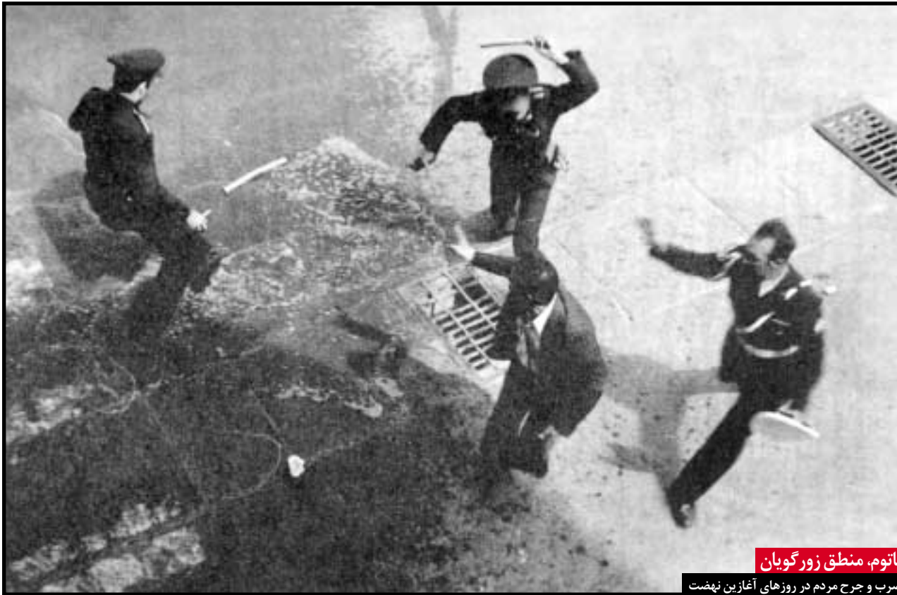
باتوم، منطق زور گویان

در صفحات پیش رو نگاهی کوتاه بر تصویری می اندازیم که هر کدام به منزله قطعه ای از یک پازل است می تواند در مجموع ما را نسبت به اوضاع آن روز واقف سازد.