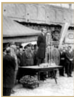
مهر ۲ بهمن ۲۱ سخنرانی امامت‌آیین محمدرضا پهلوی

اصول ششگانه موسوم به انقلاب سفید در کنگره‌ای که علی‌الظاهر به نام دهقانان و در واقع توسط رژیم حاکم در ۱۸ دی‌ماه ۱۳۴۱ در تالار ورزشی محمدرضا شاه (هفت تیر کنونی) تشکیل شده بود، با سروصدا و تبلیغات گسترده و با شعارهایی ظاهر فریب اعلام شد. این اصول که در واقع همان فرمول پیشنهادی - و در اصل تحمیلی - آمریکاییان به شاه (برای انجام اصلاحاتی اجتماعی و اقتصادی در عرصه کشور) بود، در شرایط تعطیلی مجلس شورای ملی، تصویب و اجرای آن به فرزندم عمومی گذاشته شد که این فرزندم از سوی روحانیت به رهبری امام تحریم شد.